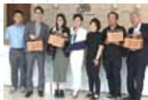
パートナー会社 AmLeisure 社と。