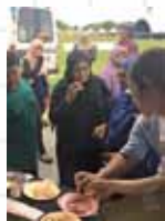
十勝の加工品を試食提供。

近年増加している海外の旅行者（特に東南アジア圏）の皆様に、一步踏み込んだ北海道の観光情報をお届けするフリーマガジンです。現在は道内の道の駅、観光案内所、宿泊施設、レンタカーショップなどに設置している他、海外ではマレーシアの旅行代理店やショッピングモール、カフェなどに設置し、北海道に興味のある外国人の方々に無料でお楽しみいただいています。