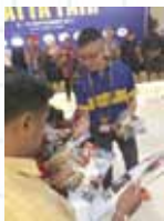
マレーシア旅行博での配布の様子。