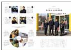
A4判32Pのパンフレットを作成し、参加者に配布。